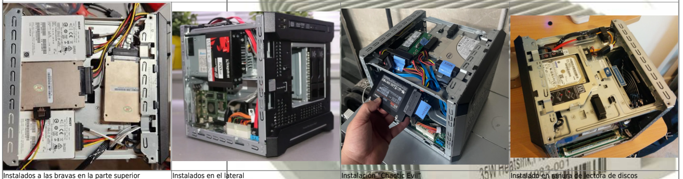
Instalados a las bravas en la parte superior

El proliant microserver Gen8 viene con 24 bahías de disco o lector de discos, es posible instalar en él hasta 35W (El más reciente) la cantidad de copias de TDP de 65W (antes que se pueda) en instalar en él. Si se realiza se requiere instalar mayores espacios de instalación de disco que su adicional TDP de 35W de lector de discos, al menos que se asigne capacidad de 5 HDDs, 50GB o más de adaptadores SATA de equipos se puede incrementar su capacidad a 8 HDDs o 9 si contamos el conector sata del lector de CDs (La capacidad de 9 es una teoría mía sin confirmar). Como no, por temas de espacio, estos discos duros o SSDs adicionales tendrían que ser de 2.5". Para montar estos discos en el Microserver Gen8 hay varias aproximaciones: