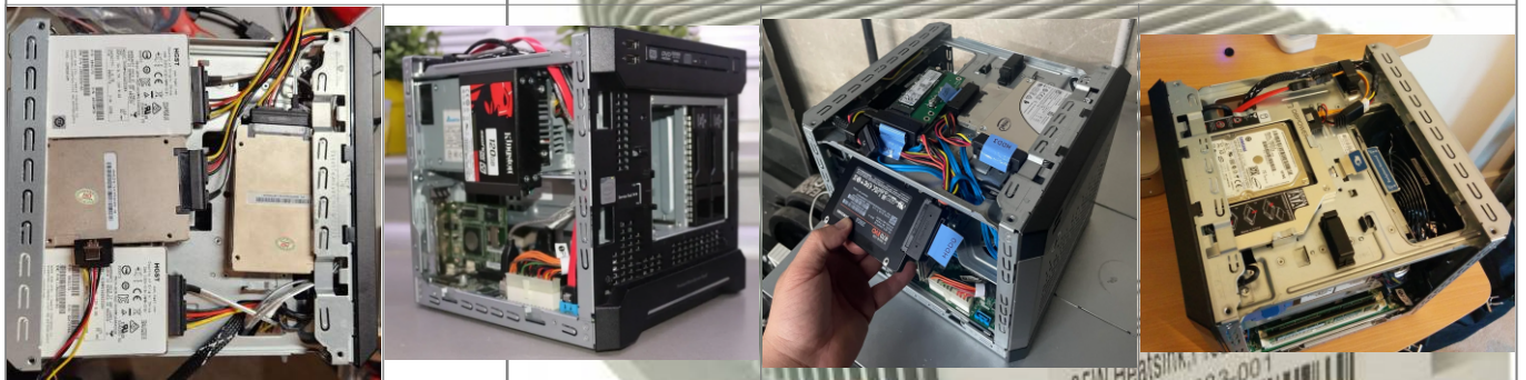
Instalados a las bravas en la parte superior

El proliant microserver Gen8 viene con 24 bahías de disco o lector de CD, es posible instalar en él entre 35W (El más común) la cantidad de copias de 2.5" de 6TB (antes que se pueda) en instalar en él. Si se realiza se requiere instalar mayor espacio de instalación de disco que adicional TDP al 35W del lector de discos, al reemplazar así una capacidad de 5 HDDs 750GB añada por ejemplo 8AW si el equipo se puede incrementar su capacidad a 8 HDDs o 9 si contamos el conector sata del lector de CDs (La capacidad de 9 es una teoría mía sin confirmar). Como no, por temas de espacio, estos discos duros o SSDs adicionales tendrían que ser de 2.5". Para montar estos discos en el Microserver Gen8 hay varias aproximaciones: