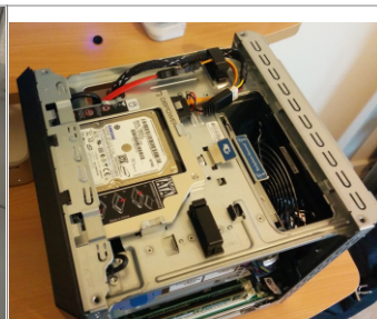
Instalado en ranura de lectora de discos