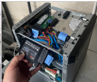
Instalación "Chaotic Evil"