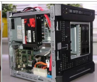
Instalados en el lateral