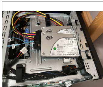
Instalados a las bravas

lector de discos, incrementando así la capacidad a 5 HDDs. Si se añade una tarjeta RAID decentilla se puede incrementar su capacidad a 8 HDDs o 9 si contamos el conector sata del lector de CDs (La capacidad de 9 es una teoría mía sin confirmar). Como no, por temas de espacio, estos discos duros o SSDs adicionales tendrían que ser de 2.5". Para montar estos discos en el Microserver Gen8 hay varias aproximaciones: