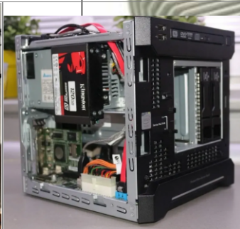
Instalados en el lateral