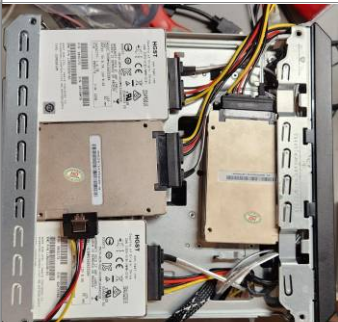
Instalados a las bravas en la parte superior

El proliant microserver Gen8 tiene como 24 disipadores de calor de frente en el espacio de los procesadores (TDP de 35W (Elaboradamente) la cantidad de calor es de 65W (antes que se puede) instalar en él. Si se realiza modificación para instalar mayores se pueden instalar un disco que su potencia TDP de 35W de los discos, al menos que tiene así la capacidad de 5 HDDs 750GB o más de los discos SSD si el equipo se puede aumentar su capacidad a 8 HDDs o 9 si contamos el conector sata del lector de CDs (La capacidad de 9 es una teoría mía sin confirmar). Como no, por temas de espacio, estos discos duros o SSDs adicionales tendrían que ser de 2.5". Para montar estos discos en el Microserver Gen8 hay varias aproximaciones: