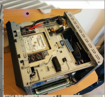
Instalado en ranura de lectora de discos